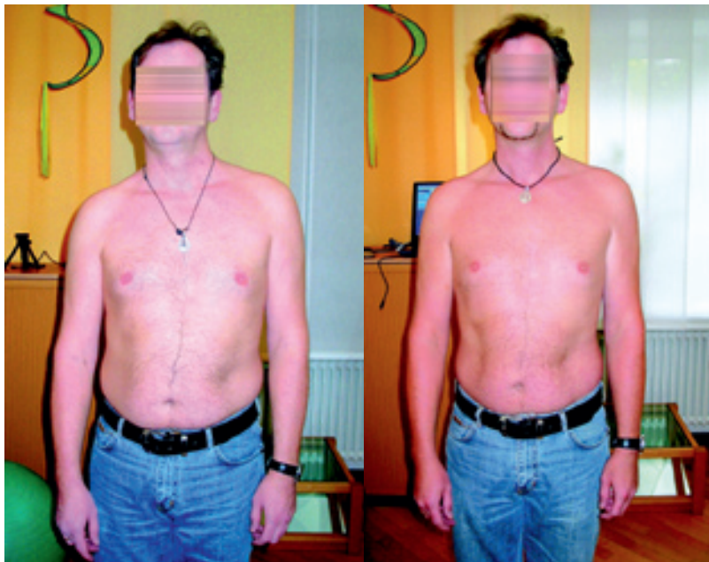
Abb. 3 links vor rechts nach Therapie

Er wendet selbst Stimulationen mit der Stimmgabel auf der linken Körperseite an, sowie Elektrostimulationen mit einem TENS-Gerät. Dies wird unterschwellig (d.h. nicht schmerzhaft) mit 10 Hz am linken Arm und linken Bein 2x täglich durchgeführt.